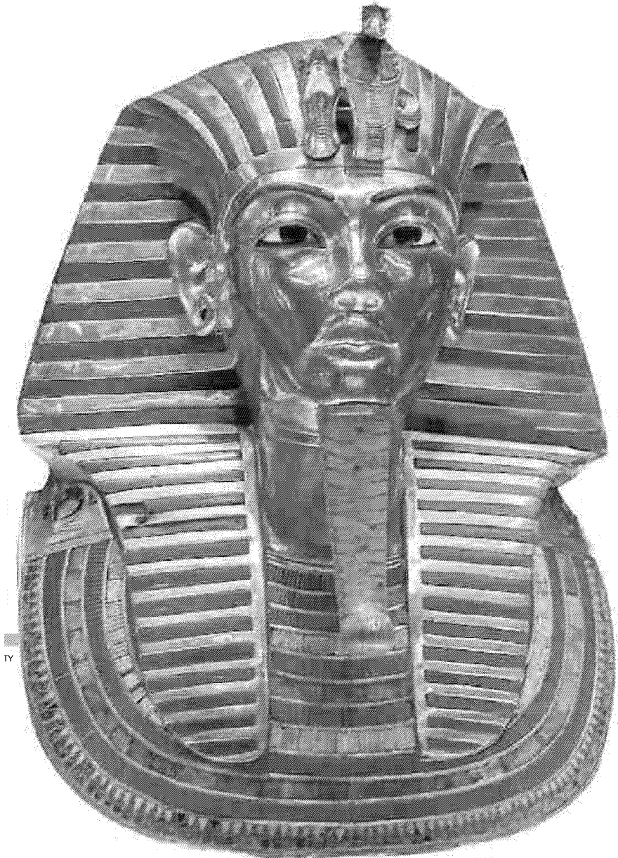
La maschera funeraria di Tutankhamon conservata nel Museo Egizio del Cairo. Dodicesimo sovrano della XVIII dinastia, regnò tra il 1333 e il 1323 a.C., quando morì a 18 anni. La sua tomba venne scoperta nel 1922 da Howard Carter e Lord Carnarvon